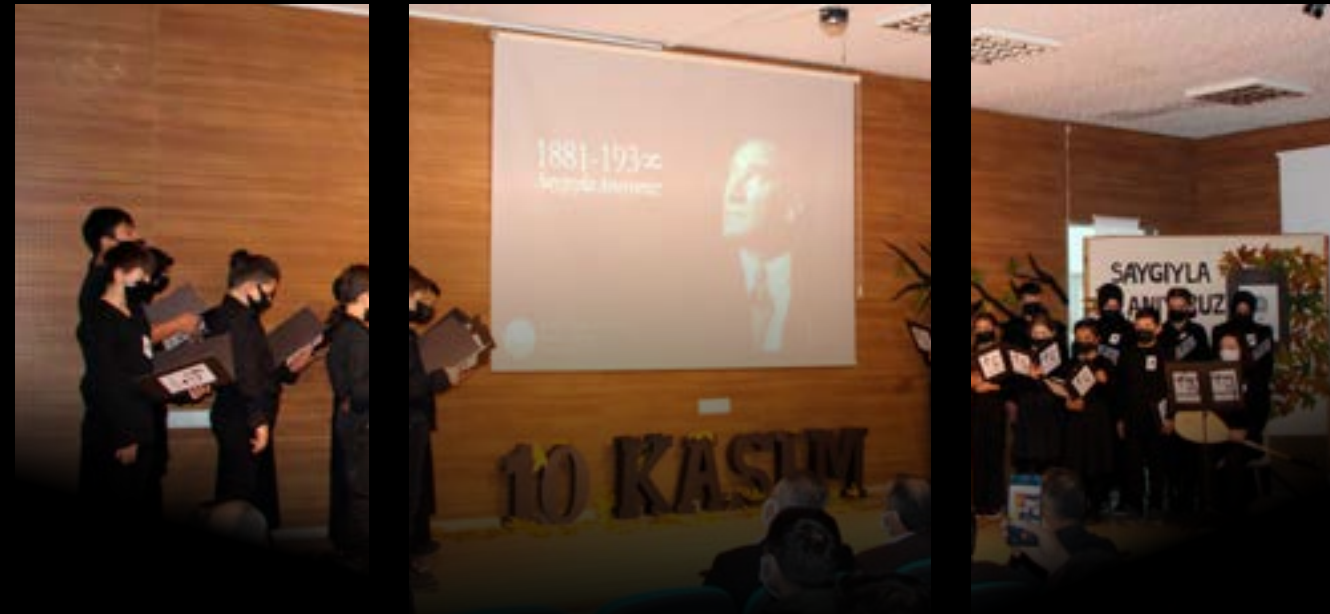
TÜRKİYE CUMHURİYETİ'NİN KURUCUSU GAZİ MUSTAFA KEMAL ATATÜRK, VEFATININ 83. YILINDA İLÇEMİZDE TÖRENLERLE ANILDI.