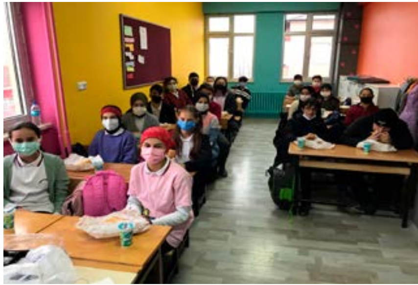
KORGAN ORTAOKULU AYIN SINIFI

Her ay okul kurallarına uyan, sınıf düzen ve temizliğine dikkat eden, sosyal etkinliklere katılan ve görgü kurallarına uyan sınıfı "Ayın Sınıfı" olarak seçiyoruz.Ayın sınıfı seçilen sınıfı ödüllendirerek ve onurlandırarak öğrencileri olumlu davranmaya yönlendiriyoruz.Ayın sınıfını seçerek öğrencilerin başarılı, ahlaklı, terbiyeli ve saygılı olmanın teşvik edici davranışlar olduğunun önemini kavratmayı hedefliyoruz.