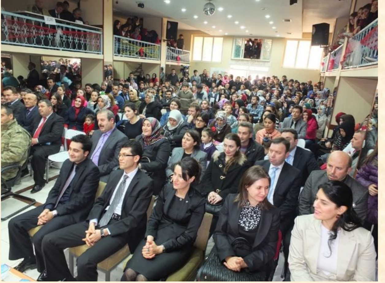
"Duyur Sesini Korgan 3" 2013-2014 Eğitim Öğretim Yılı