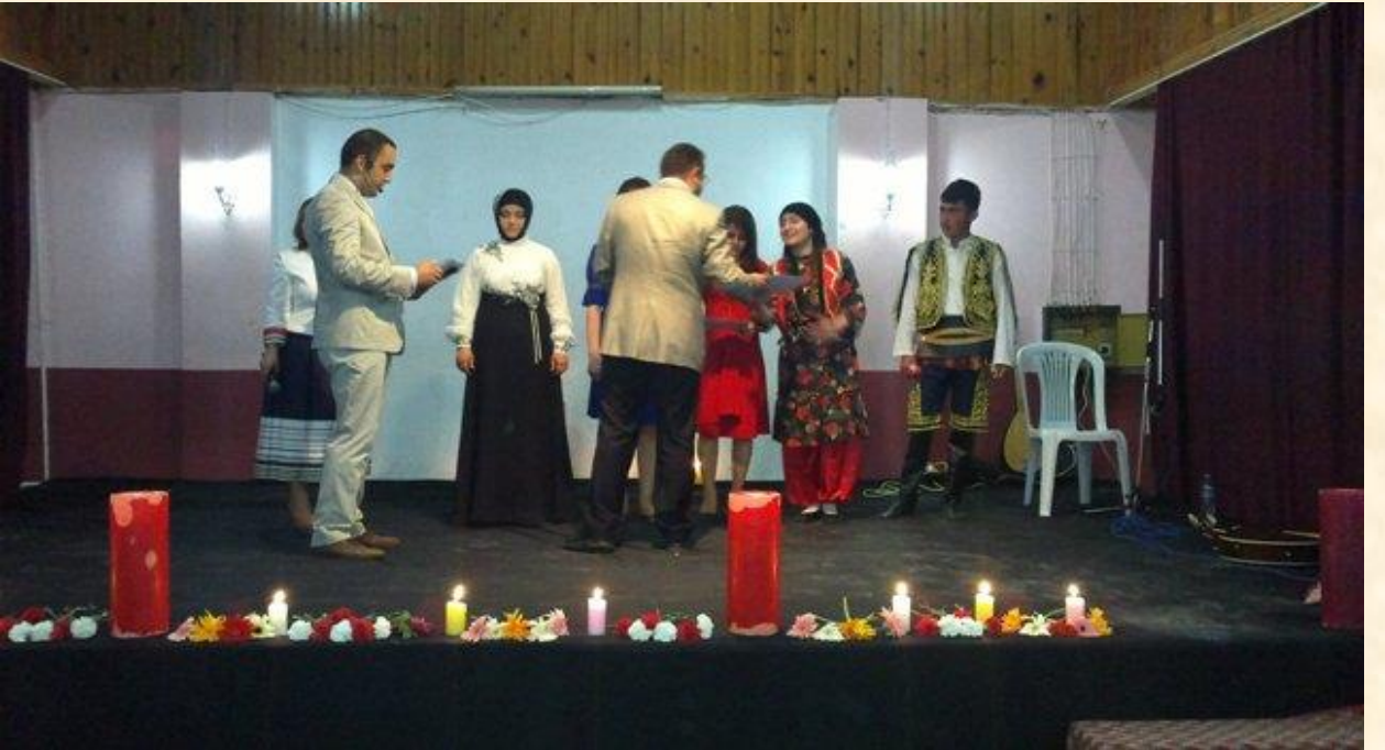
"Duyur Sesini Korgan 2" 2012-2013 Eğitim Öğretim Yılı