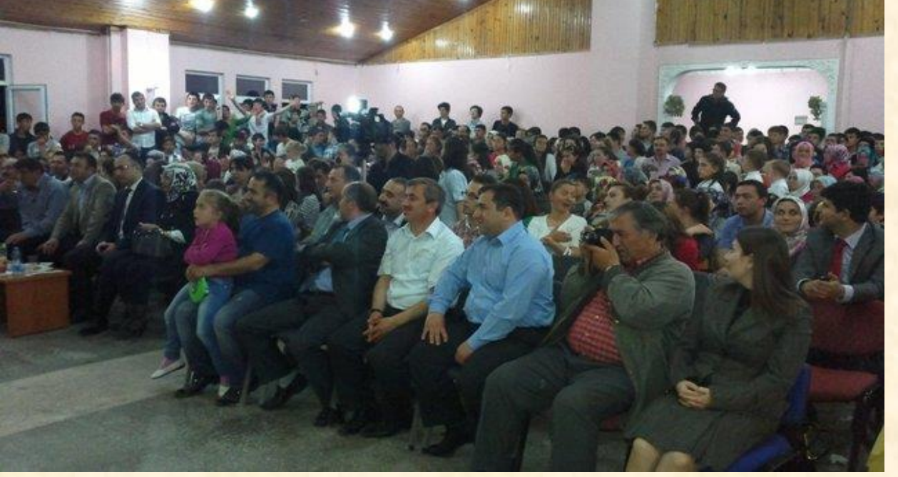
"Duyur Sesini Korgan " 2011-2012 Eğitim Öğretim Yılı