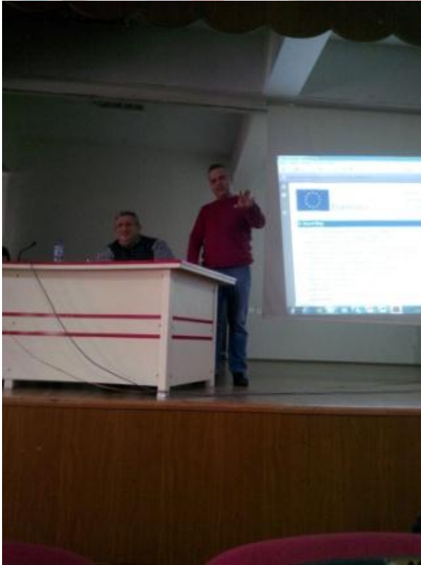
ORDU MEM AVRUPA PROJELERİ TOPLANTISI