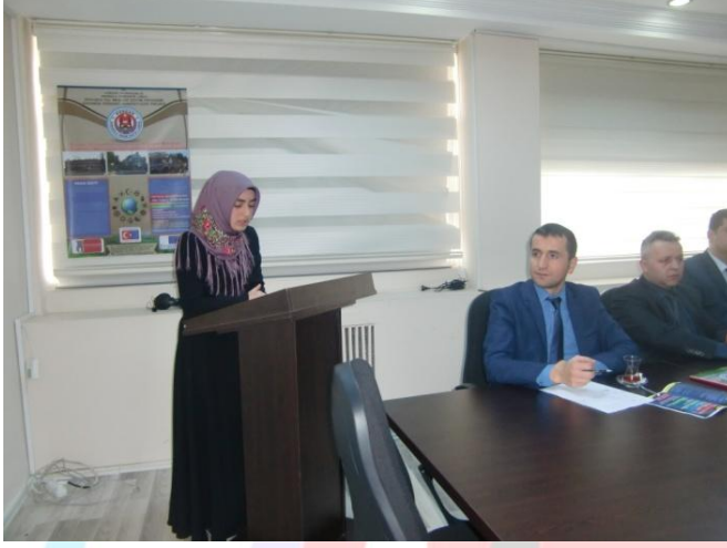
PROJENİN BASINA TANITILMASI