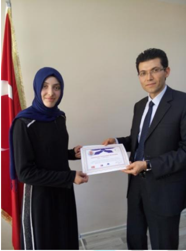
ÖĞRENCİLERİMİZ SERTİFİKALARINI ALIRKEN