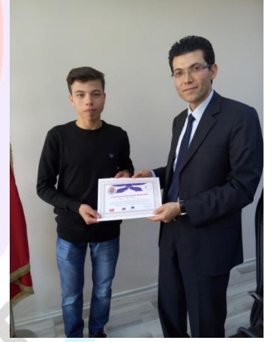
ÖĞRENCİLERİMİZ SERTİFİKALARINI ALIRKEN