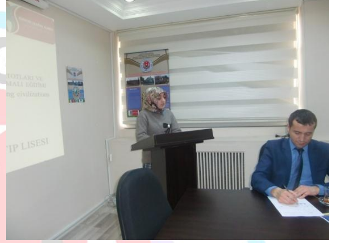
PROJENİN BASINA TANITILMASI