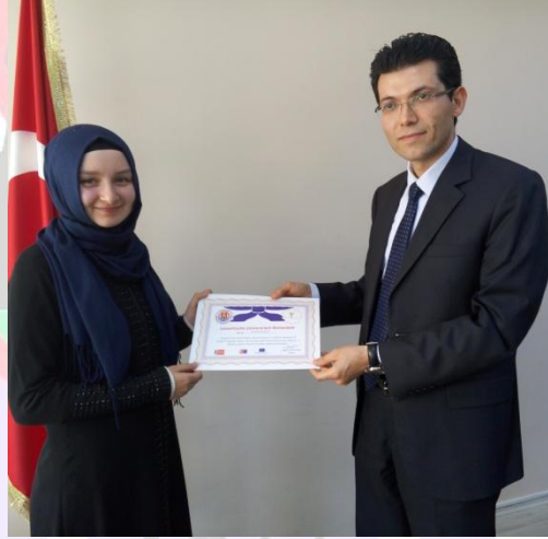
ÖĞRENCİLERİMİZ SERTİFİKALARINI ALIRKEN